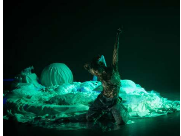
Spongebabe in L.A. , Mercedes Dassy

Juxtaposition d'un espace quotidien avec un espace onirique. La scénographie de la photographie et sa mise en scène reflètent l'état intérieur du personnage.