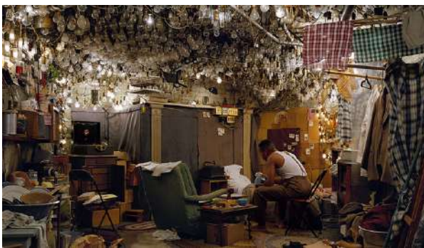
After Invisible Man by Ralph Ellison, the Prologue , Jeff Wall

Seul en scène d'un personnage féminin, entre fiction et réalité, danse et chant, qui aborde notre capacité profonde à la métamorphose et à la transformation.