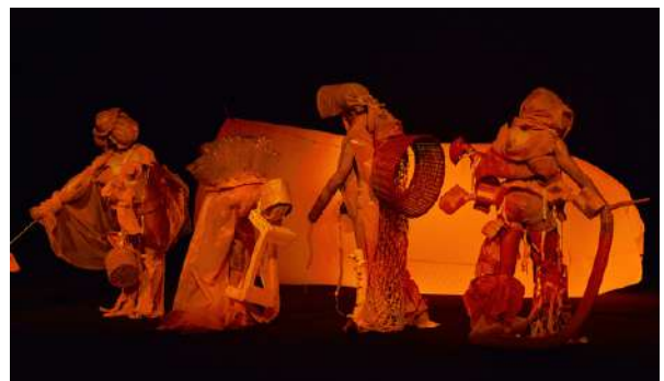
MONUMENT 0.10 : The Living Monument , Ezster Salamon

Accumulation des objets dans cette photographie, en particulier des ampoules, qui transforme l'espace quotidien en un monde onirique et poétique, de l'ordre du réalisme magique.