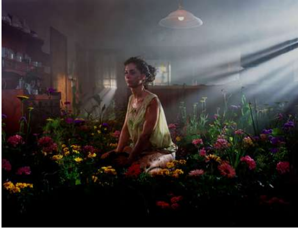
Untitled , Gregory Crewdson, 1998

Juxtaposition d'un espace quotidien avec un espace onirique. La scénographie de la photographie et sa mise en scène reflètent l'état intérieur du personnage.